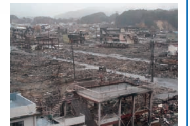
津波の災害 (東日本大震災2011年)