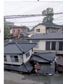
地震による倒壊 (熊本地震2016年)