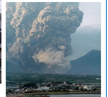
噴火の災害 (有珠山噴火2000年)